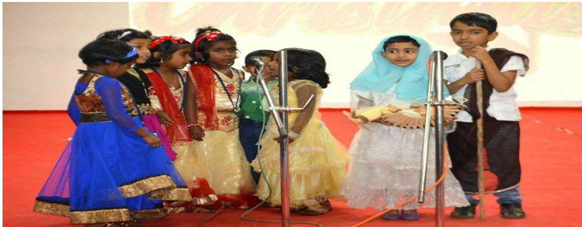
Students of Marian Buds program engaged in Christmas celebration