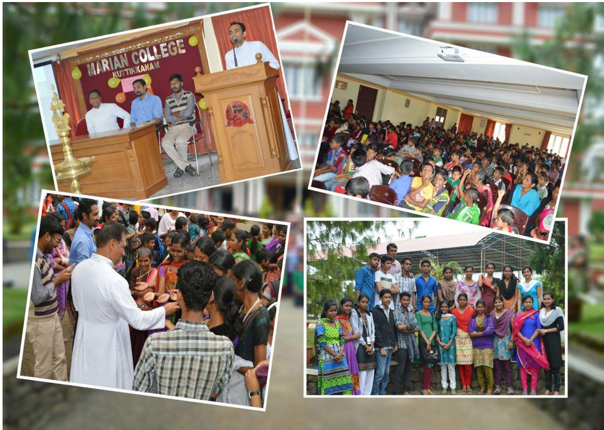
The inaugural ceremony and first day of Marian Buds program organized by Marian College Kuttikkanam (Autonomous)